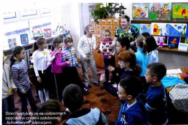
Dzieci spotykały się na codziennych zajęciach w czytelnicy ozdobionej „kubusiowymi” ilustracjami.